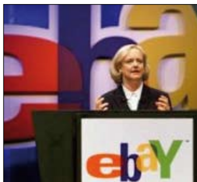
Meg Whitman, Présidente d'Ebay depuis 1998.

Dès 1997, la plate-forme d'enchères a mis en place le programme Verified Rights Owners (VeRO), qui permet aux titulaires de droits enregistrés de signaler sur l'honneur, à l'aide d'un formulaire, les annonces contrevenantes. Selon Ebay France, « la majorité des notifications VeRO est traitée en quatre heures ». Le vendeur et les enchérisseurs reçoivent un courriel indiquant le motif du retrait de l'annonce, avec les coordonnées de l'entreprise plaignante. En revanche, Ebay préserve l'anonymat de