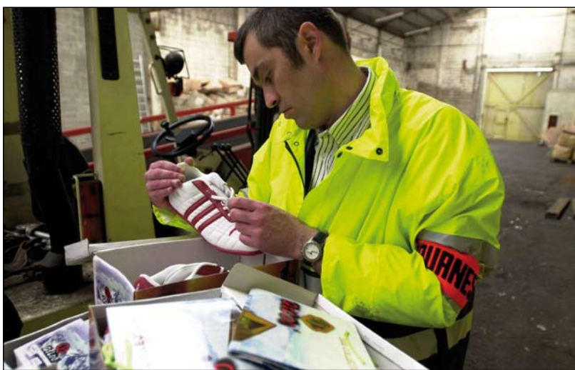
La surveillance du réseau permet d'intercepter des produits illicites, toujours acheminés par voie postale ou par fret.

Il faut beaucoup de patience et de persévérance pour s'attaquer aux marchés parallèles en ligne, dont l'ampleur suscite souvent un sentiment d'impuissance. C'est un métier.