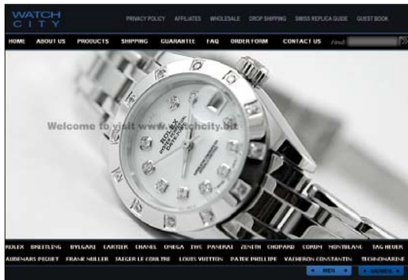
Un site spécialisé dans la contrefaçon horlogère.

En premier lieu, les données relatives aux titulaires de noms de domaine sont très fréquemment erronées, voire anonymisées par le registrar lui-même, qui se contente souvent d'un numéro de