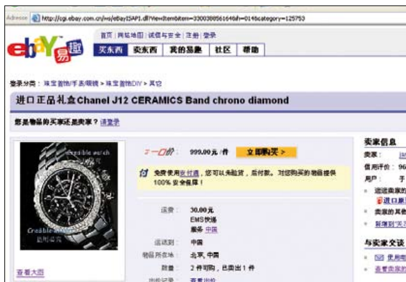
«Credible watch» : annonce pour la vente d'une fausse montre Chanel sur Ebay Chine.

Plusieurs facteurs expliquent la hausse de la contrefaçon, en particulier horlogère, sur le Net. D'abord, le faible coût d'entrée sur le marché : acheter un nom de domaine, créer un site et l'activer, se donner de la visibilité par un bon référencement – quelques clics de souris et un investissement négligeable ! Car très souvent, ces sites ne font que revendre des produits provenant de plus loin en amont dans la chaîne de distribution. Le risque pris par les contrefacteurs est lui aussi très faible, en raison du fréquent défaut d'informations au sujet des éditeurs de site (données de l'annuaire des titulaires des noms de domaine Whois fausses, anonymisées ou fantaisistes ; noms de domaine payés avec des numéros de carte de crédit volés ou falsifiés). Enfin, le fait que l'importation « capillaire » (achats individuels des consommateurs) passe plus facilement au travers des mailles du filet des douanes – contrairement aux importations en grandes quantités – contribue à faciliter le trafic ; et les pla-